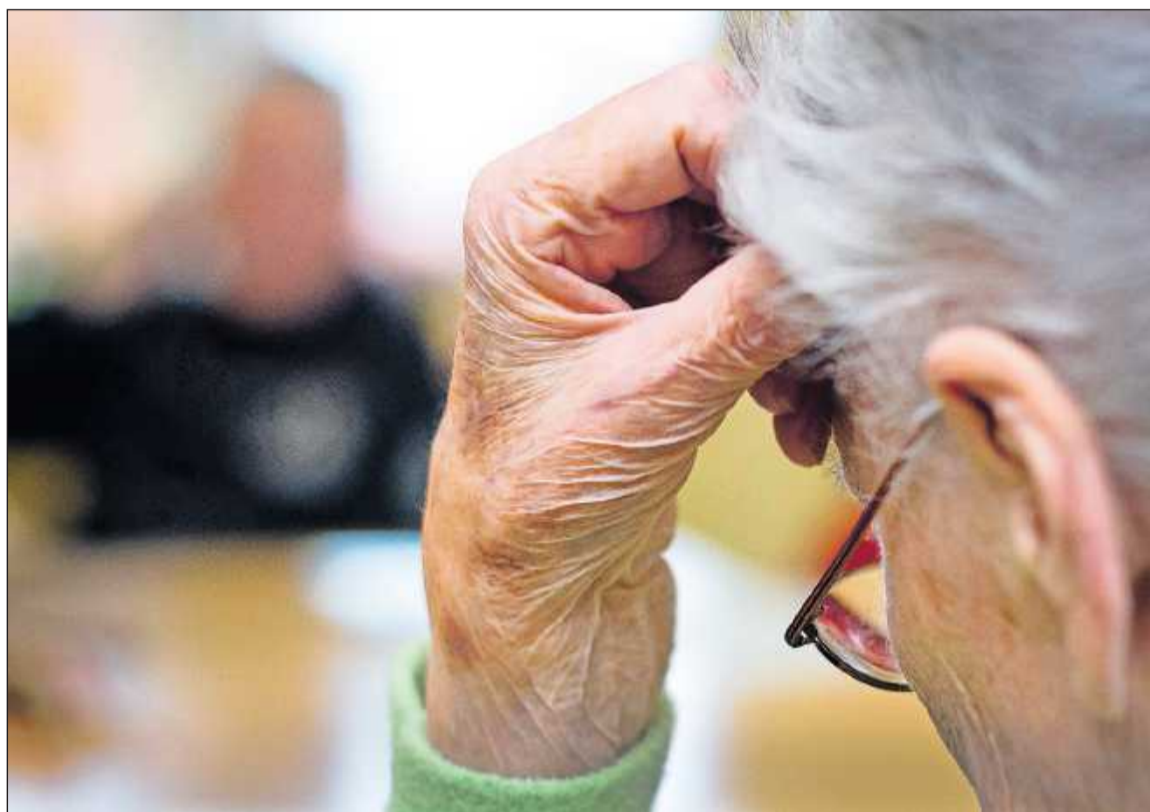
Mit der Demenz ändert sich auch das Verhältnis zwischen Betroffenen und Angehörigen.