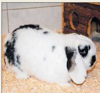
Hübsches Kerlchen: Der kleine Schecke Hias würde sich über ein wenig weibliche Gesellschaft freuen.